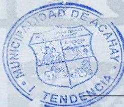
Alcides Sosa Báez Intendente Municipal.